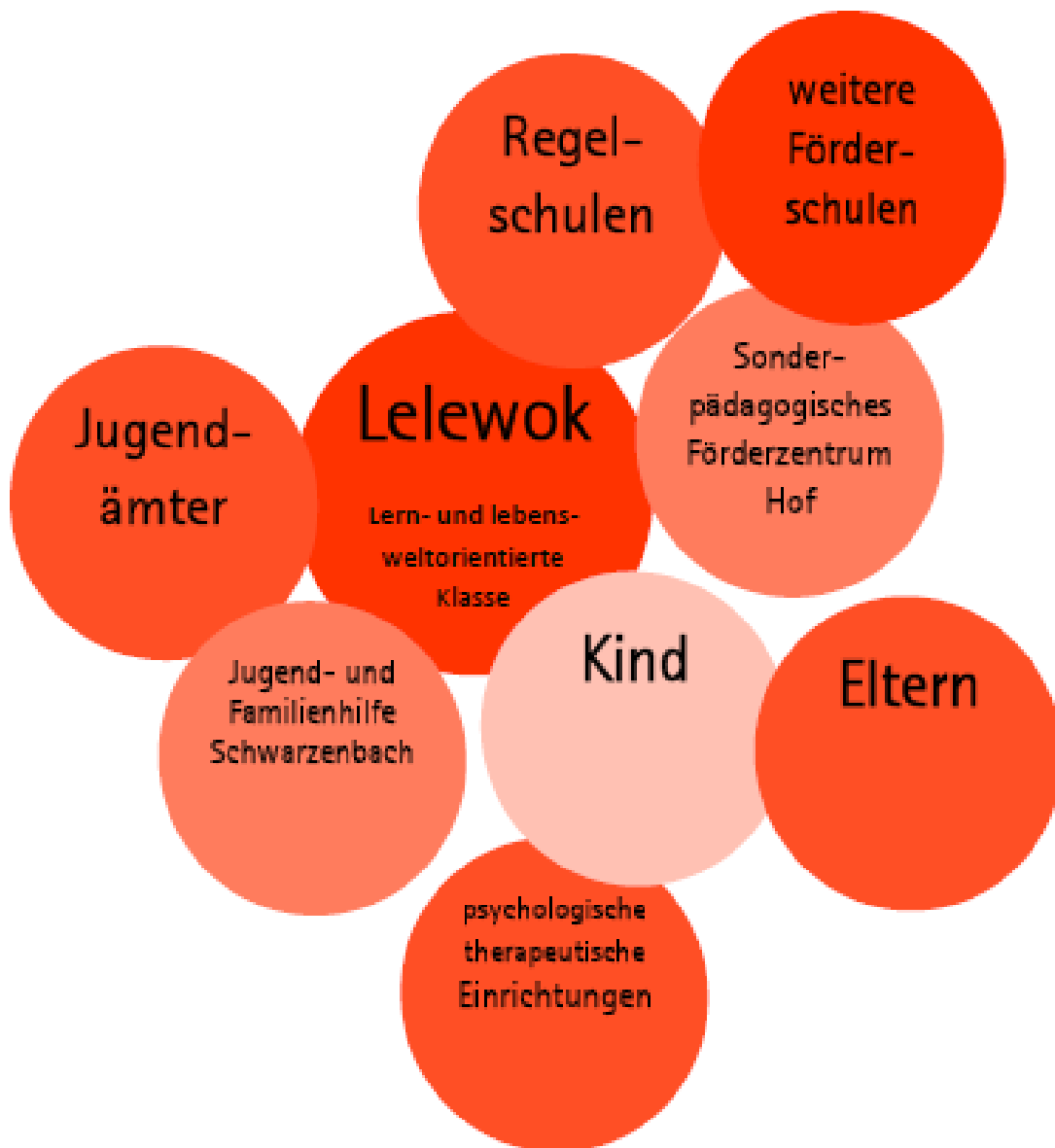
Abb. 2: Synopse über die personell-institutionelle Zusammensetzung der Lelewok